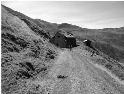
Ruïna dels edificis (colònia obrera i tallers) de l'explotació minera (segle xx) (1). Foto: Andreu Balent, agost de 2017

27 de desembre de 1966: va ser la fi de l'explotació definitiva de la mina i mener del Pimorent.