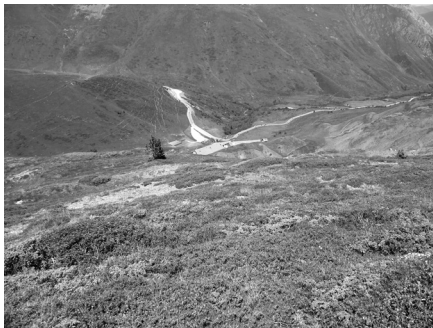
Vista general del mener i de la colònia minera. Foto: Andreu Balent, juny de 2015

Des de fa poc se sap que, a la muntanya de Pimorent el ferro va ser explotat i transformat des de l'antiguitat. Sis localitzacions (zona del Pimorent; prop de les boques del túnels, al pla de les lules, prop de la confluència entre el riu de Malforat i l'Aravó, entre Porta i Querol) de baixos forns antics (II aC – VIII dC) es van fer el 2016. També es va fer un sondeig més acurat.