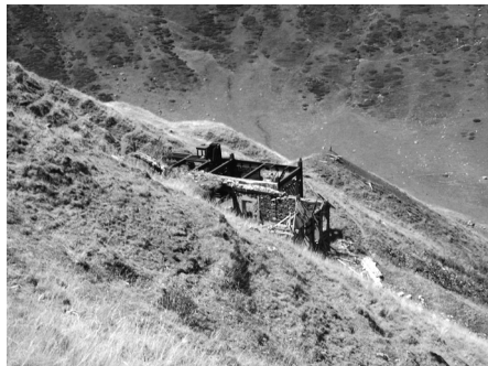
Ruïna del punt de partença del cable aeri (segle xx). Foto Andreu Balent, agost de 2017

De 1941 a 1944 foren presents a la mina del Pimorent, a més d'uns joves de la vall de Querol, uns elements del 407 e Groupement de Travailleurs Étrangers de Perpinyà, sobretot uns refugiats espanyols de La Retirada. També el 1943 i el 1944 foren incorporats a la plantilla joves requisats del STO (Service du travail obligatoire) de Perpinyà i de la Catalunya del Nord. La mina va acabar per inserir-se del tot al marc de